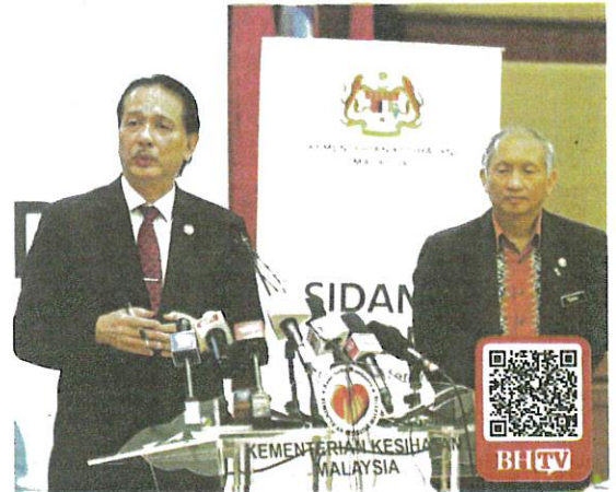
Dr Noor Hisham pada sidang media harian COVID-19 di Putrajaya, semalam.

Dr Noor Hisham Abdullah, Ketua Pengarah Kesihatan